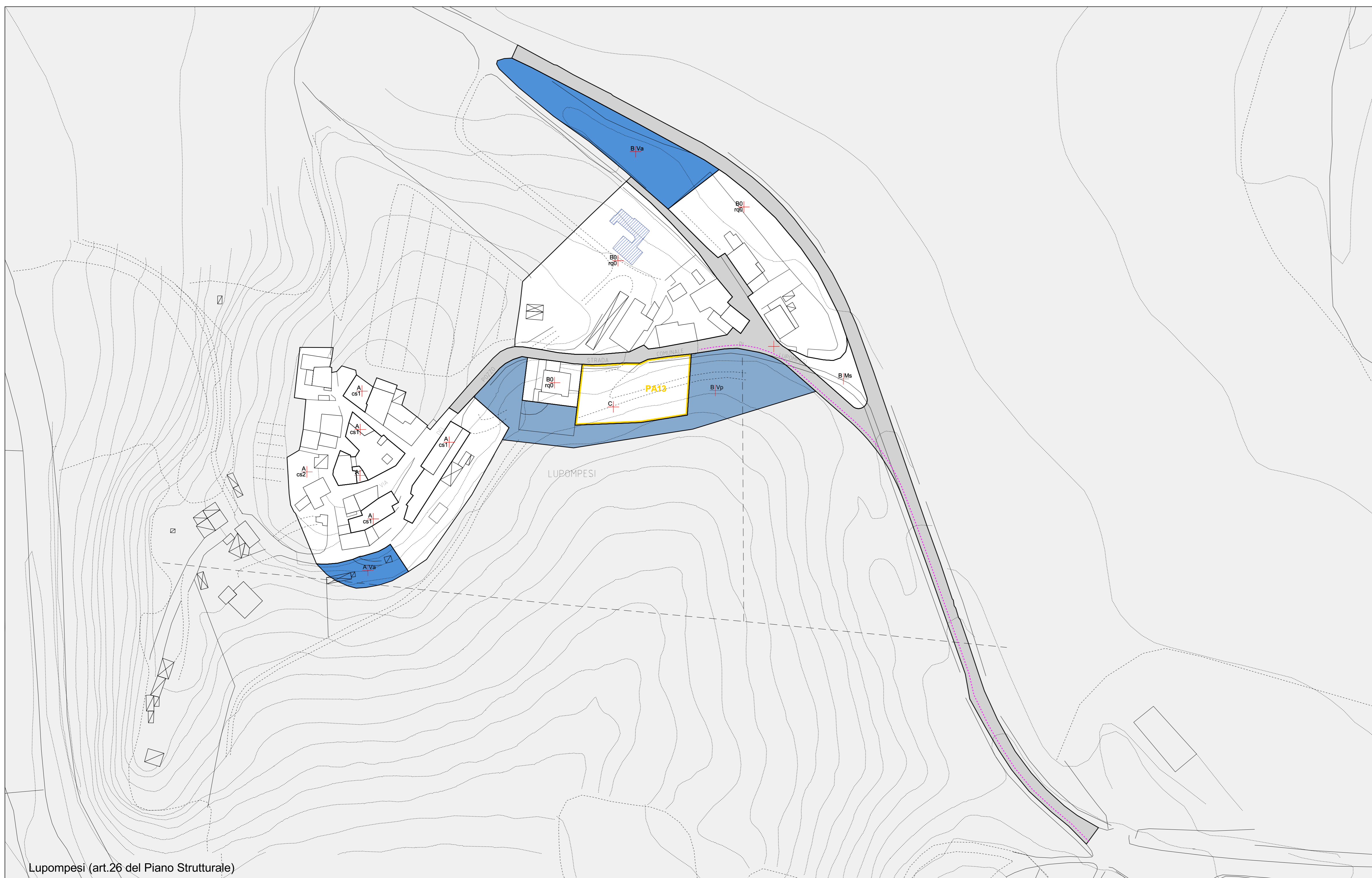
Lupompesi (art.26 del Piano Strutturale)